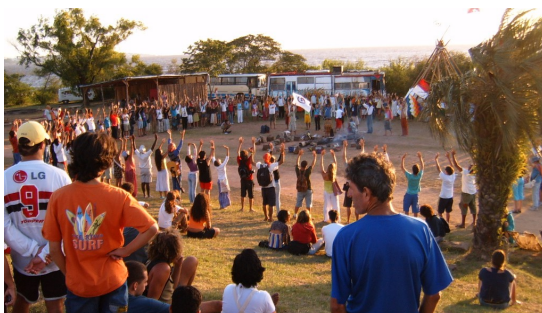
Aldea da Paz, 5è FSM a Porto Alegre, Brasil, Gener 2005.