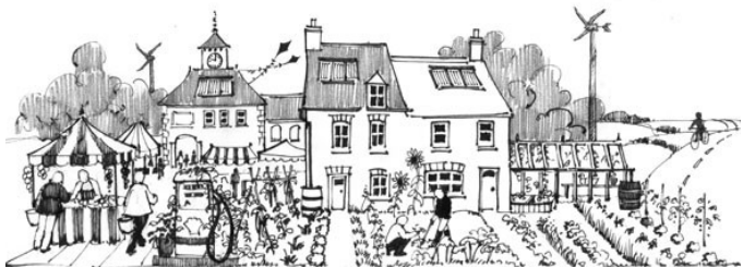
Dibuix de la portada del llibre de Rob Hopkins

The transition handbook. From oil dependency to local resilience. Rob Hopkins