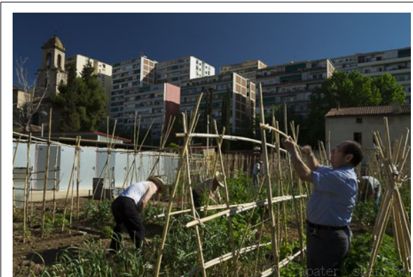
Hort comunitari de Can Cadena, Barcelona

per ser alhora els seus propis productors: l'autogestió.